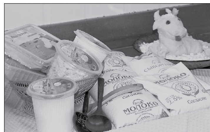
Продукция СПК «Согласие» – от коровки до упаковки.

двое тонны сливочного масла, столько же сметаны и в общей сложности около ста тонн 2,5-3-процентного пастеризованного молока. Порядка сотен тонн расфасовывают для продажи в полиэтиленовые пленочные пакеты, еще примерно шестьдесят продается на розлив. Рынок молочных продуктов относится к одному из самых конкурентных, поскольку ежедневно в город приезжают многочисленные молочные автоцистерны из соседних районов. Именно поэтому в полиэфиле пакеты дают возможность многим жителям города приобретать молоко по более низким,