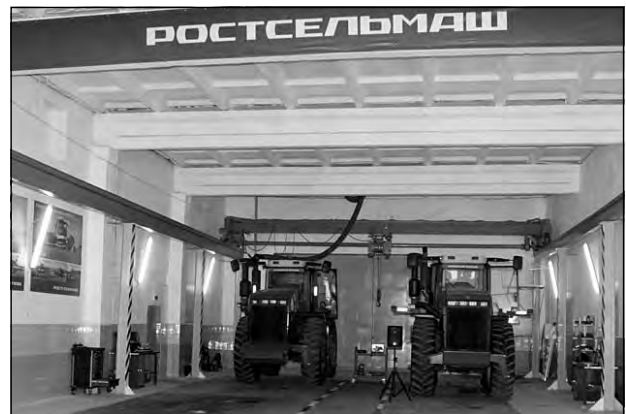
Сервисный цех тракторов VERSATILE.

занимает прочные позиции в пятерке крупнейших мировых производителей сельхозтехники. Ростсельмаш – это группа компаний, состоящая из 13 предприятий со сборочными производствами, расположенными в России, США, Канаде, Казахстане и на Украине. На сегодняшний день предприятия, входящие в группу компаний Ростсельмаш, выпускают весь спектр техники, необходимой клиентам в течение сельскохозяйственного года. Компания производит продукцию под брендами ROSTSELMASH, VERSATILE, FARM KING и имеет заводы в России, Европе, Канаде, США. Продуктовую линейку компаний Ростсельмаш составляют свыше 100 моделей и модификаций сельскохозяйственной техники. Реализация продукции Ростсельмаш, ее предпродажная подготовка и сервисное обслуживание осуществляются через крупнейшую дилерскую сеть, располагающую более чем 500 филиалами и сервисными центрами во всем мире.