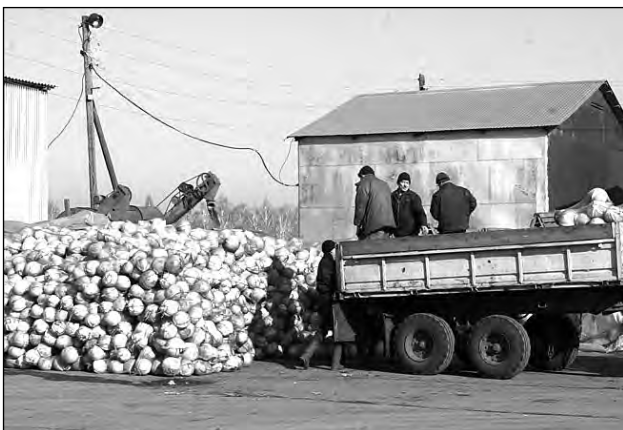
Нынешней осенью в колхозе «Вишневецкий» собрали богатый урожай капусты – более ста тонн с гектара.