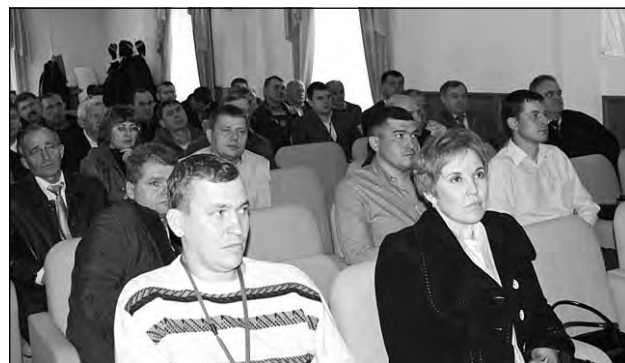
На пленарной части мероприятия.

висного сопровождения техники Ростсельмаш. Фактор реального технического обслуживания, по-видимому, и сыграл решающую роль в победе двух тракторов марки VERSATILE (Ростсельмаш) в тендере, организованном кемеровским губернатором среди поставщиков с/х техники на право стать призом администрации области для лучших хозяйств.