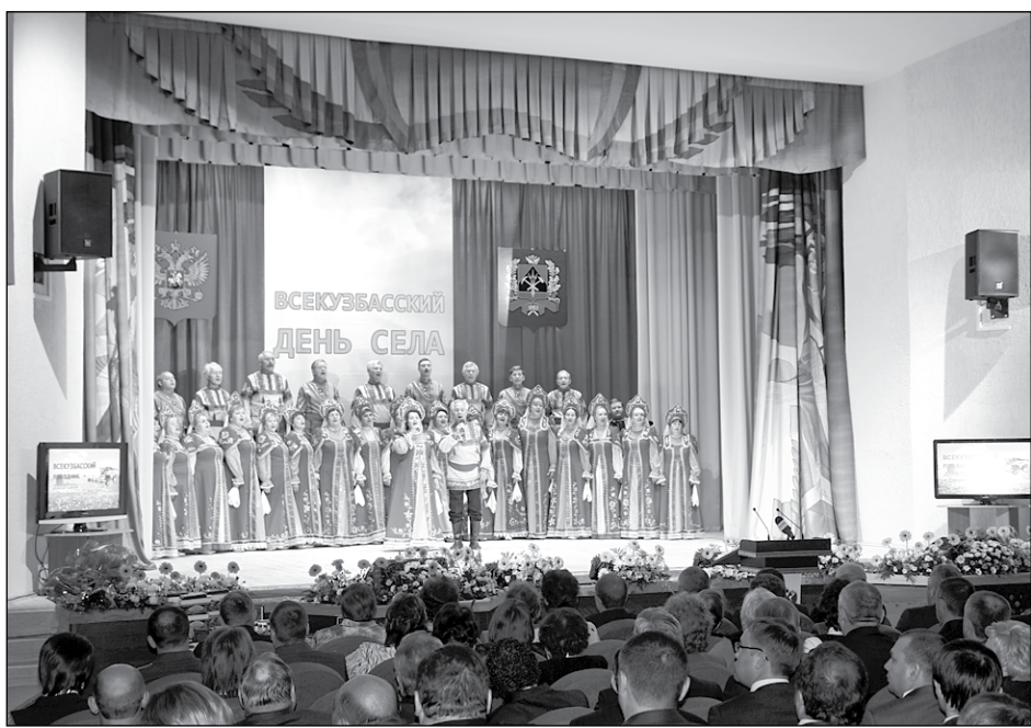
Праздник в обновлённом Доме культуры.