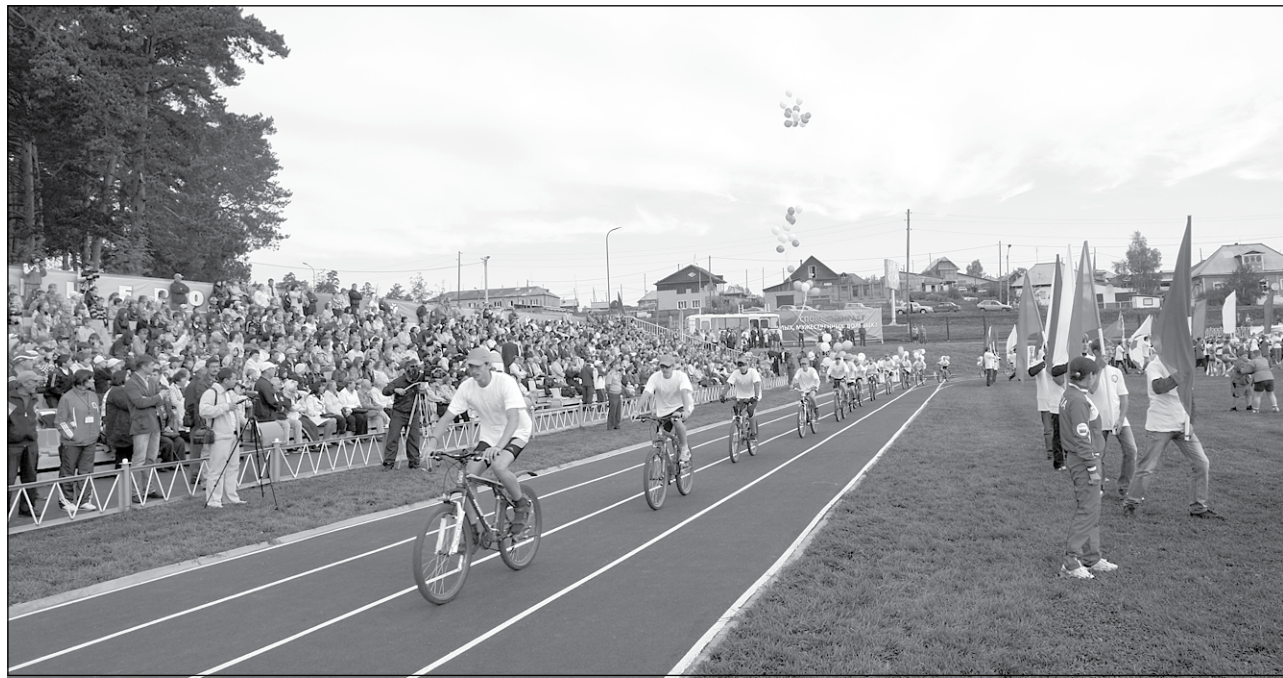
Новую беговую дорожку первыми опробовали участники II Всекузбасских сельских летних игр.

- Да. Вот смотрите. Малая Салаирка у нас в этом году – центр проведения праздника. Конечно, нужно было привести в порядок Дом культуры. Все сделали: дизайн, хорошую акустику, хорошие кресла, вентиляцию, заменили «одежду» сцены. Но этим уже никого не удивишь. Главная изюминка – флуоресцентные шторы. Нам их делал художник с мировым именем, это полотно ткали специально для нас.