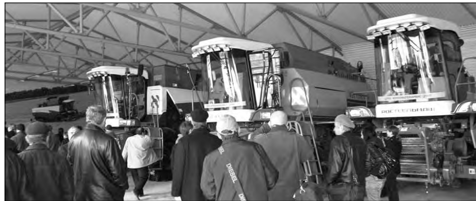
В выставочном павильоне Ростсельмаш.

ники марки «Клевер», специализированный сервисный цех тракторов VERSATILE, своими глазами увидела на складе запасы оригинальных запчастей на технику производства Ростсельмаш. Сервисная служба была наглядно представлена специально оснащенными сервисными автомобилями. Руководители АПК «Сибирь» (Прохопьевский р-н), входящие