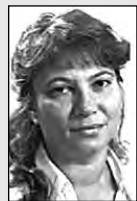
Ответственная за выпуск Елена ЦЕРБАКОВА.

Уважаемый читатель! По-прежнему ждем твоих вопросов. Пиши, звони. Наши телефоны: 72-50-45, 72-38-23.