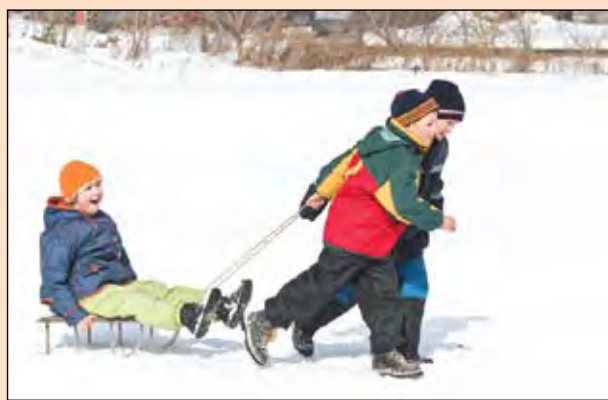
Поговорим о транспорте. Когда пассажиры из сел наконец-то смогут воспользоваться льготами и как выбирать санки.