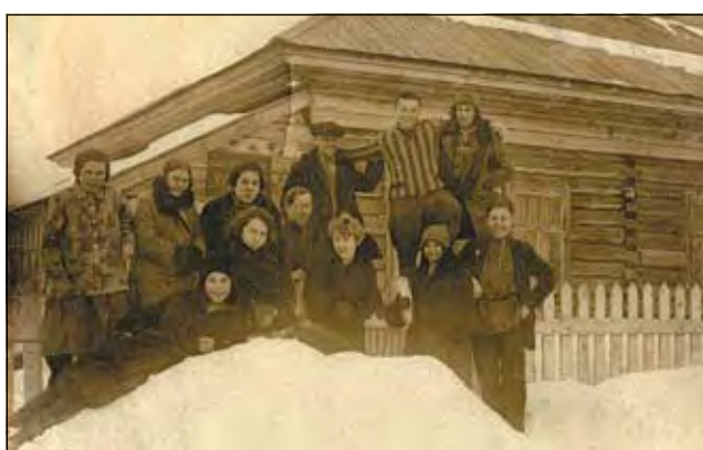
Здание и коллектив «Кузбасса» образца 1931 года.