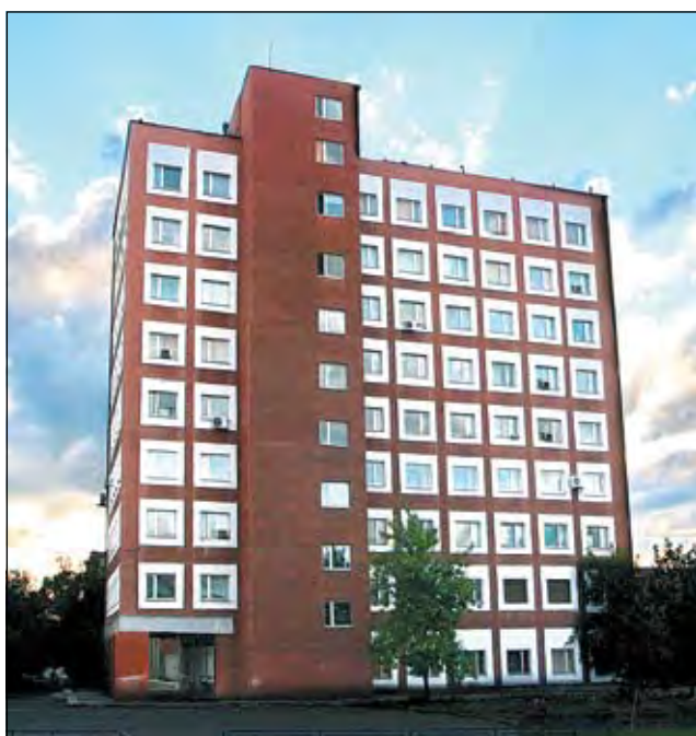
Сегодняшний дом «Кузбасса» по пр. Октябрьскому, 28.

В выходных данных каждого качественного издания обязательно присутствует адрес редакции. Это свидетельство того, что газета намерена поддерживать связь с читателями, ориентироваться на их интересы. Листая подшивки «Кузбасса», убеждаешься: все 90 лет своей истории газета не скрывала своего адреса.