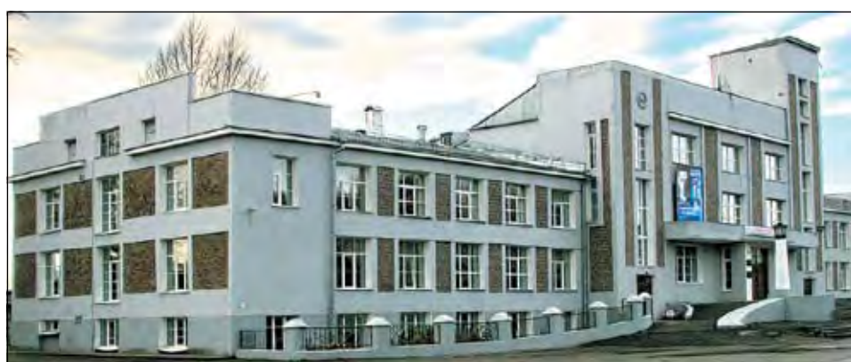
Дворец труда (ныне Кемеровское областное училище культуры).