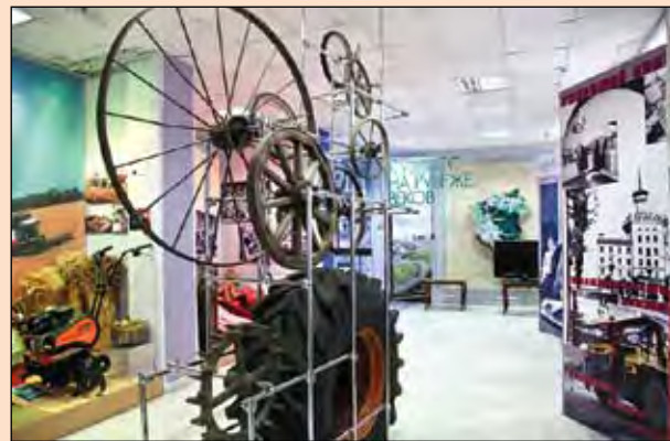
История даже не повторяется дважды, а движется по кругу: трагедии сменяют фарсы, а потом всё отражается на выставках.

«Мама, милая мама, как тебя я люблю!» А как именно? Есть прекрасный повод показать это, придумав особенный подарок самому близкому человеку.