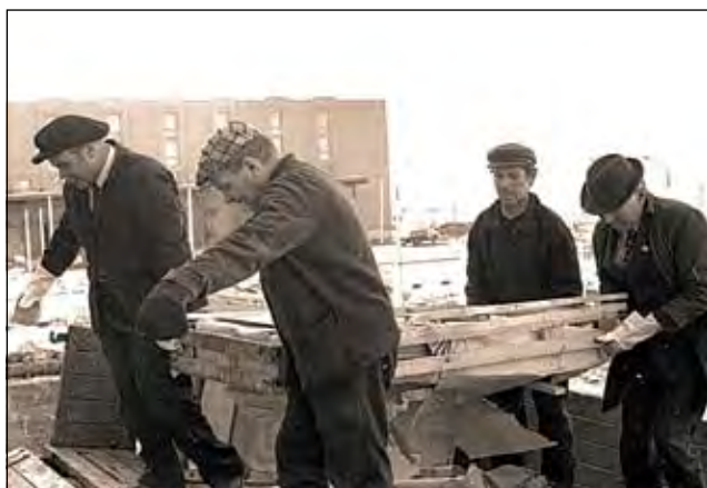
«Кузбассовцы» грузят мебель (1981 год).