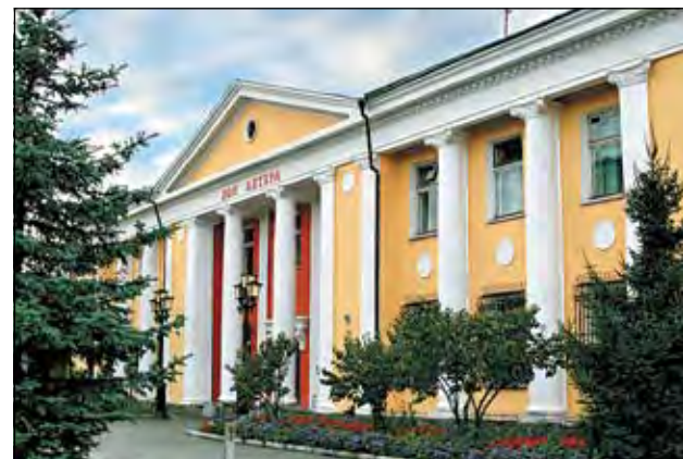
Обособник на ул. Трудовой, 64 (ныне Дом актера, ул. Боброва, 1).

Этот переезд, кстати, совершенный без приглашения грузчиков со стороны, не решил всех проблем. Если для журналистов были созданы все условия – просторные светлые кабинеты с телефонами, наконец-то обретенный актовый зал для проведения массовых мероприятий, то типография оставалась в ветхом строении, где полы и потолки грозили рухнуть под весом оборудования. И потому руководство редакции начало хлопоты о строительстве полиграфического комплекса. К середине 1970-х такие комплексы уже имели Новосибирск, Красноярск, Омск, заканчивалось строительство в