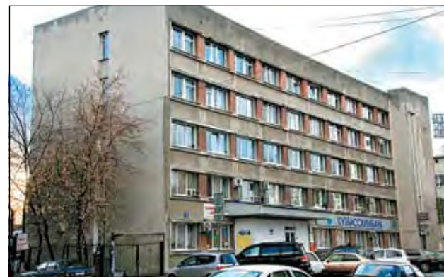
Здание по ул. Ноградской, 3 (ныне главный его арендатор – «Кузбассхимбанк»).

Томске. А Кемеровской области в такой роскоши отказывали по причине малотиражности областной газеты. И только когда тираж «Кузбасса» перевалил за 250 тысяч, Москва дала «добро».