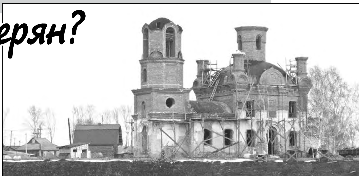
Так храм выглядит сейчас.