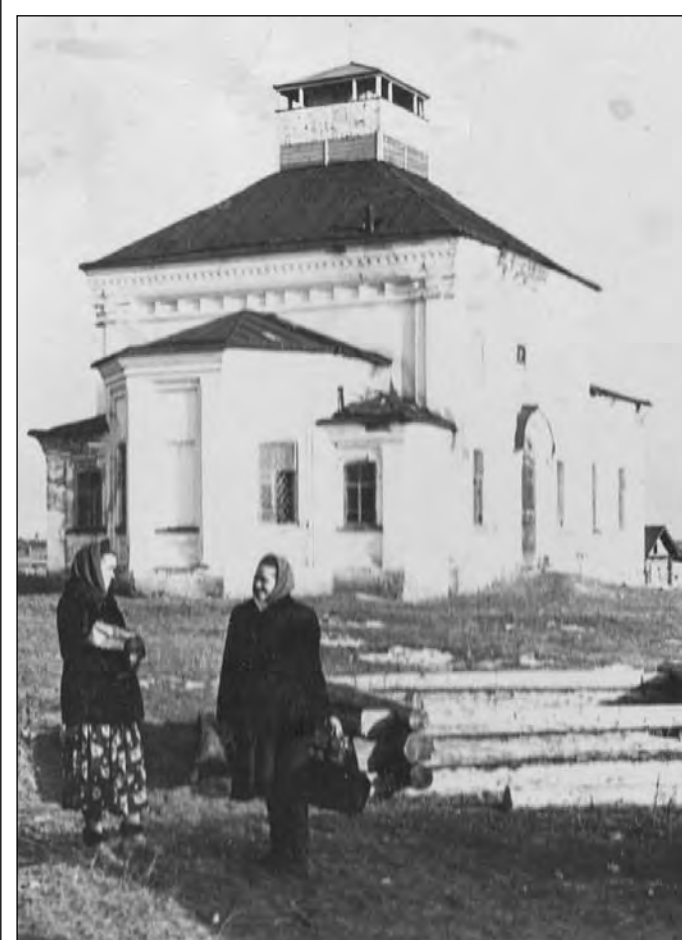
Так храм выглядел в 1945 году.