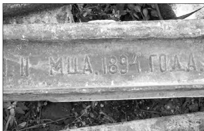
Рельс из основания колокольни.