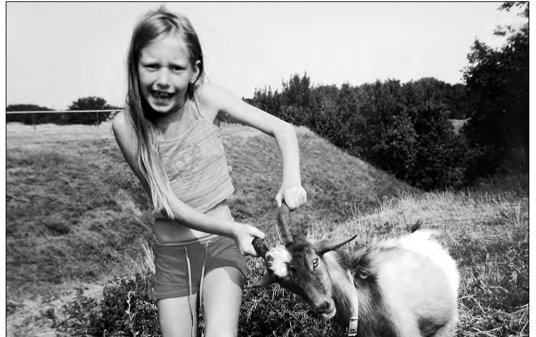
«Давай, давай бодаться» - снимок Марии Кузнецовой (г. Прокопьевск, шк. № 71, 3-й класс).

Снимки принимались по трем номинациям: «Они нуждаются в охране» (редкие и исчезающие животные); «Домашние любимцы» (оби-