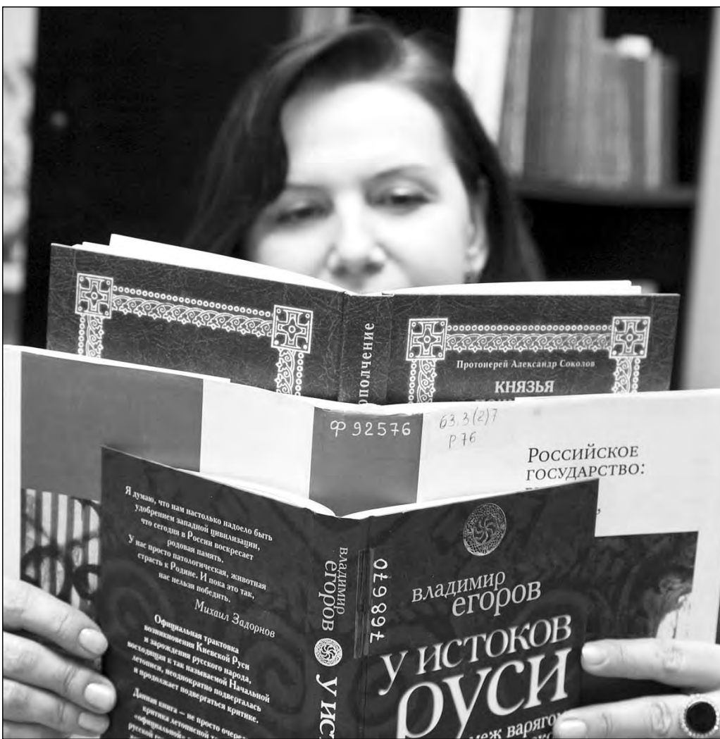
Вчера в Кемеровской областной научной библиотеке начала работу выставка «Единство России сильна», посвященная как раз Дню народного единства.

И, знаете, мнение, что современная молодежь не интересуется историей, не подтверждается. Наши дети знают историю. Они задают умные вопросы и достаточно хорошо знают многие ответы. А если чего-то не знают, то с удовольствием слушают. Просто нужно иногда чаще обращать их внимание на какие-то события. Как говорится, ткнуть носом в тему. Направить в нужную русло. А спрос на историческую литературу в библиотеке был всегда. Историей интересуются не только студенты перед сдачей экзаменов.