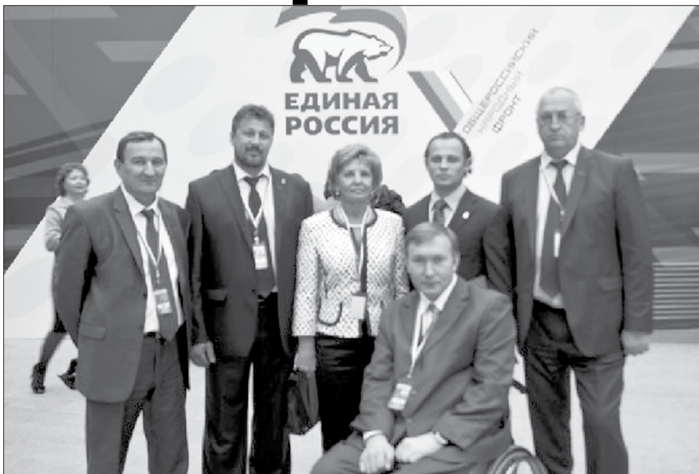
Участники съезда из Кузбасса.

На прошедшем в Москве первом этапе XII съезда партии «Единая Россия» разрешился главный политический вопрос страны накануне думских выборов. На нем была окончательно утверждена общедоменная часть списка кандидатов на выборы в Госдуму. Напомним, список единолично возглавил нынешний президент страны Дмитрий Медведев. Вместе с тем были утверждены и кандидаты в депутаты Госдумы от регионов. В частности, региональная группа кандидатов от Кемеровской области под номером 44 в общем списке представлена одиннадцатью кандидатами.