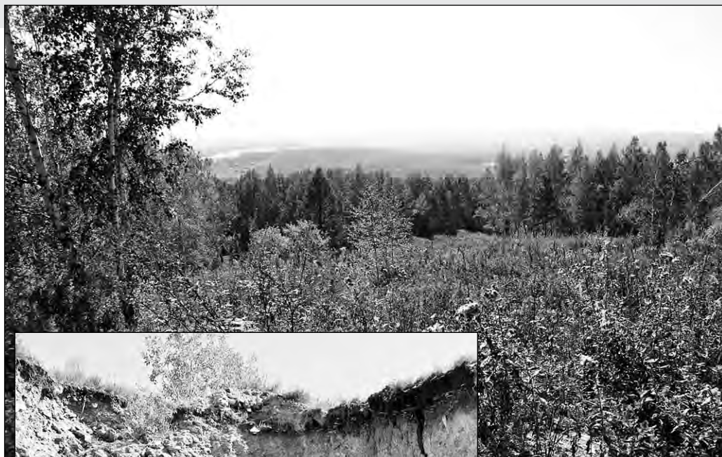
Обзор с горы «Копна».

Словом, легенд столько, что они могут пригодиться на любой случай жизни. И думаешь, стоя на вершине: а почему бы Колчаку действительно здесь не остановиться? Обзор для составления военной стратегии просто великолепный! Да и красиво очень.