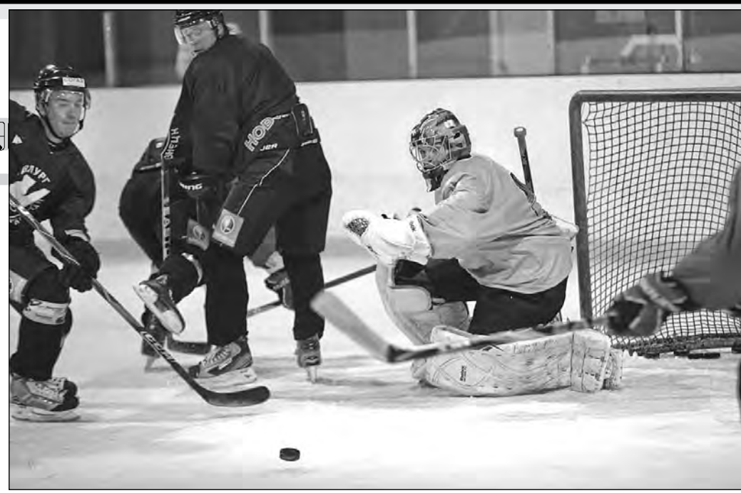
Предматчевая разминка сложилась неудачно: капитан команды получил травму.

С первых минут стало ясно, что новокузнецчанам необходимо немного времени, чтобы адаптироваться к льду. Немудрено, что в первом периоде инициативой владели хозяева. Несколько раз они промахивались из выгодных ситуаций, дважды упустили возможность реализовать выходы «всех в одного». Но все-таки в последнюю пятиминутку удача улыбнулась челябинцам: Владимир Антипов «на пятячке» подставил