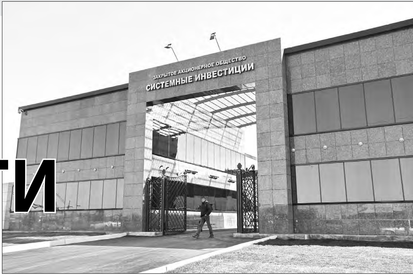
Название новой прокопьевской компании в духе самой программы. Государство дало даже не деньги, а систему.