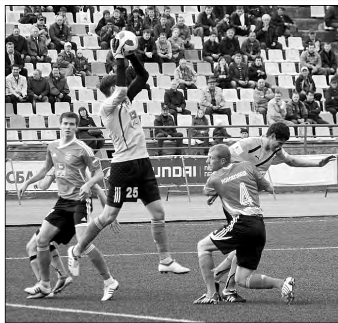
Кузбасские дерби традиционно проходят в упорной борьбе.