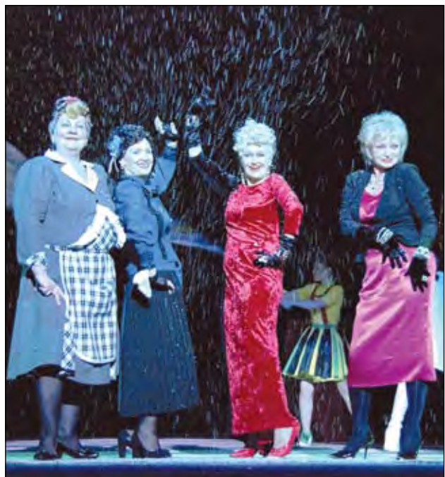
«Восемь любящих женщин».

Распахнет свои двери для зрителей 21 сентября. Откроется 70-й (юбилейный!) сезон спектаклем «Волшебные желуди». Однако для артистов этот сезон начался гораздо раньше. Правда, премьеры спектакля «Поведитель крыс» (пьеса красноярского драматурга А. Хромова, постановка Д. Вихрецкого) была показана только избранным. В сентябре театр планирует вести этот спек-