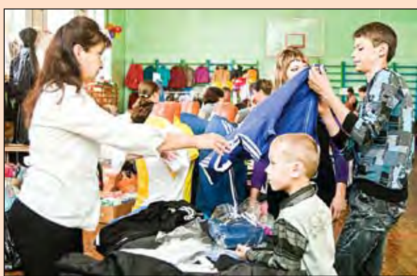
Перед началом учебного года – ответы на «школьные» вопросы, но есть и «больничные», и «домашние».