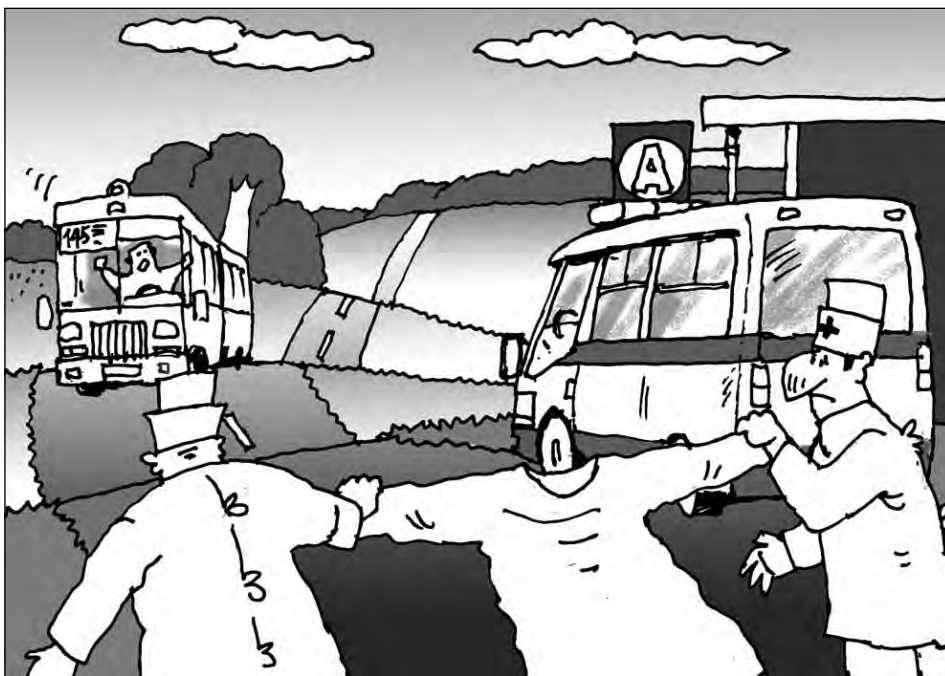
Рис. Андрея Горшкова.

Аналогичные ситуации, когда водитель требует выйти на конечной остановке, а пассажир – ни в какую, возникают довольно часто, и не только у нас в России.