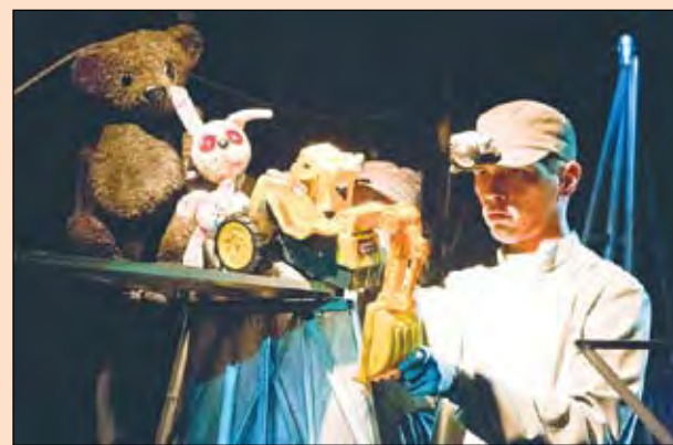
Театры Кузбасса готовятся к новому сезону, а мы готовим читателей к предстоящим «культпоходам».