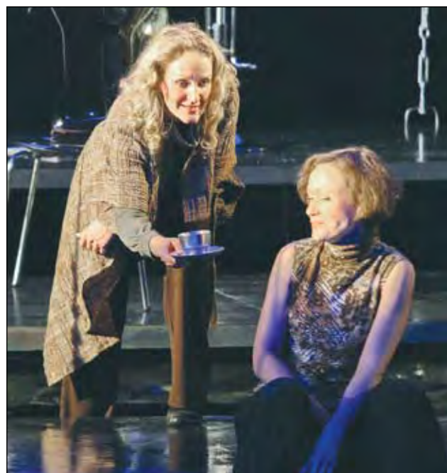
«Я боюсь любви».