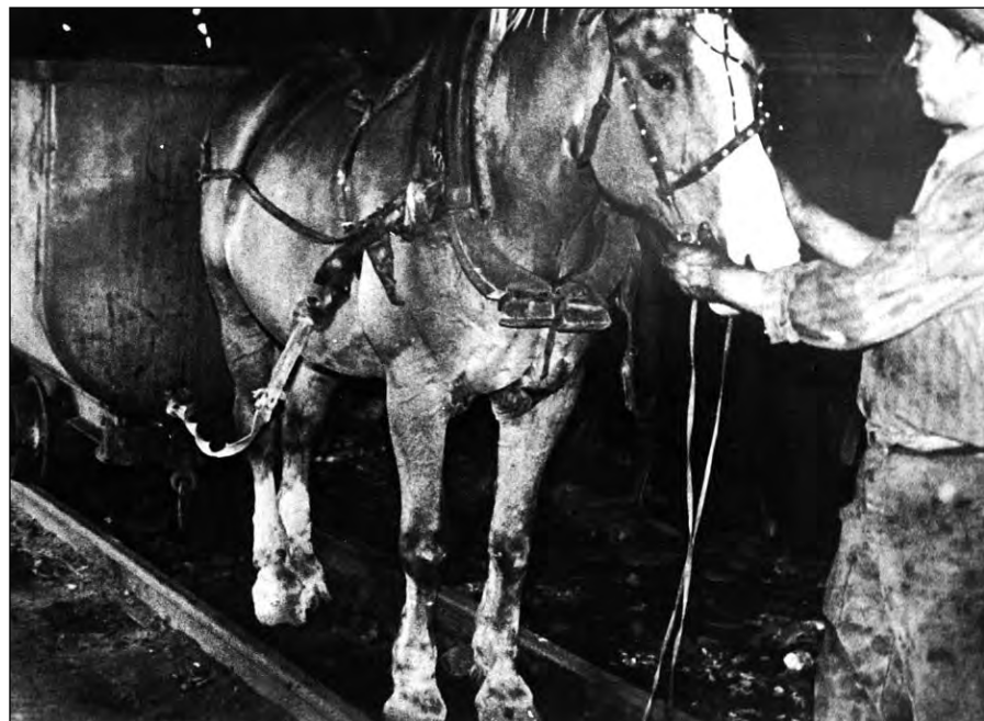
Конная откатка угля. 40-е годы.

Наряду с фотографиями здесь можно увидеть подлинные предметы шахтерской экипировки 1950-1980-х годов: каску, шахтовый фонарь, самоспасатель, спецодежду и другие интересные экспонаты.