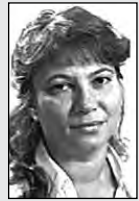
Ответственная за выпуск Елена ЦЕРБАКОВА.

Уважаемый читатель! По-прежнему ждем твоих вопросов. Пиши, звони. Наши телефоны: 72-50-45, 72-38-23.