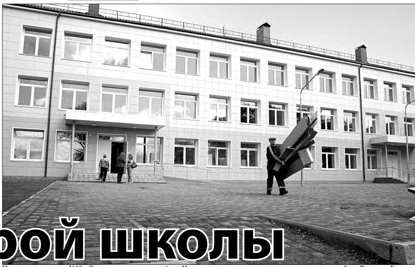
Новая-старая школа №99 в Орджоникидзевском районе Новокузнецка.