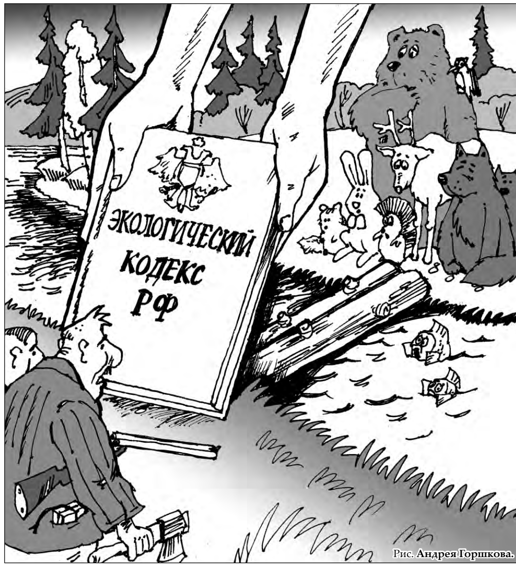
Рис. Андрея Горшкова.

Да, у нас есть 144 закона по экологии, но они настолько объемны и порой противоречивы, что даже профессиональные экологи не сразу могут разобраться, что там имеется на самом деле в виду. В свою очередь, в основе нашего производства стоят экономика, прибыль, решение текущих задач, которые возникают перед собственником. А что будет дальше, собственника (часто и не живущего в регионе, где обеспечивается его эко-