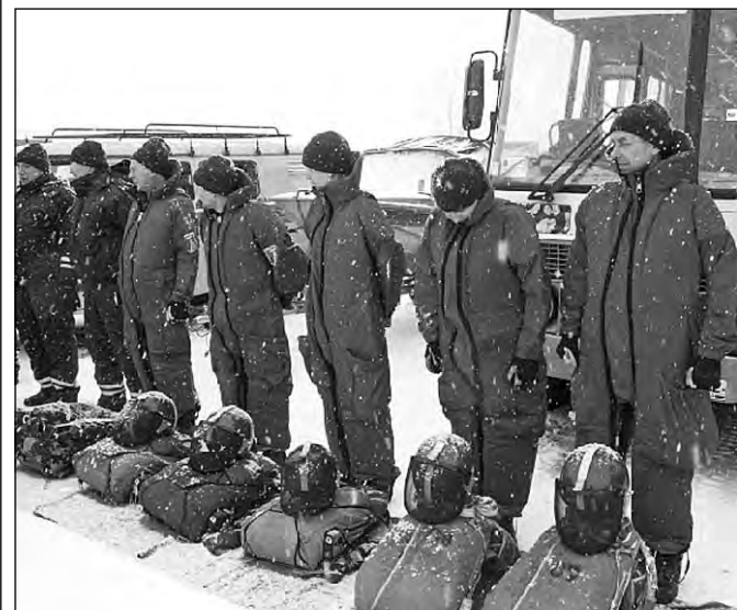
В чрезвычайной ситуации на помощь готовы прийти и парашютисты.

На проведение противопаводковых мероприятий в этом году из областного бюджета выделено около 11 млн. руб. Всего, учитывая средства крупных и мелких предприятий, муниципалитетов, – около 165 млн.