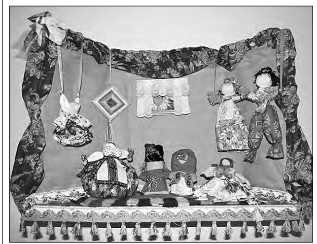
НА СНИМКЕ: композиция художницы Богачевой (Гурьевск).