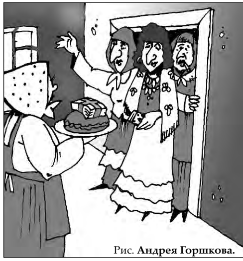
Рис. Андрея Горшкова.

В Прокопьевске из перьевой подушки 63-летней пенсионерки исчезли свыше 150 тысяч рублей, отложенных на «черный» день. Это случилось как раз после магического обряда лечения, но, как оказалось, черная магия здесь была ни при чем.