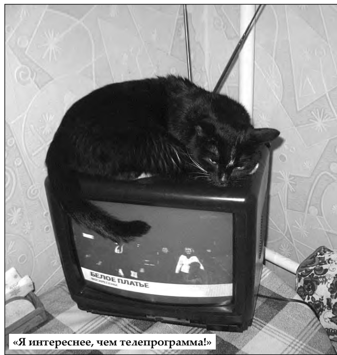
«Я интереснее, чем телепрограмма!»

И благодарим всех наших читателей, кто принял участие в этой рубрике. Надеемся, что они и дальше будут радовать вас своим теплом.