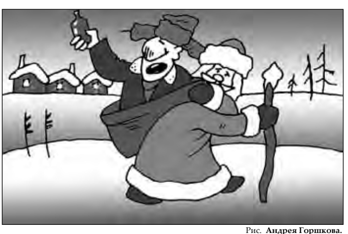
Рис. Андрея Горпикова.

Приехавшие полицейские решили взять под арест двух особенно шумных женщин. Сотрудники правоохранительных органов повалили их на пол и надели на них наручники. Другие участники акции раскритиковали действия полицейских и назвали их неприемлемыми.