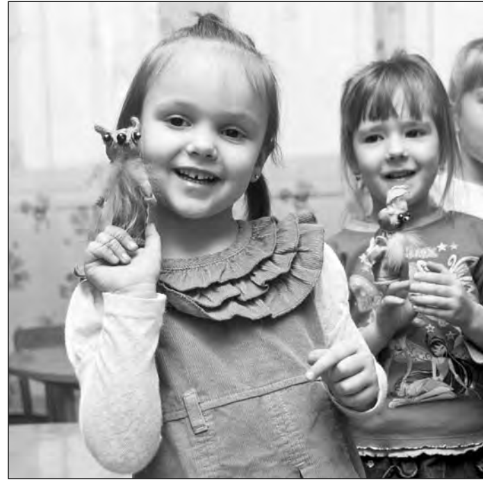
В «Сказочной стране».