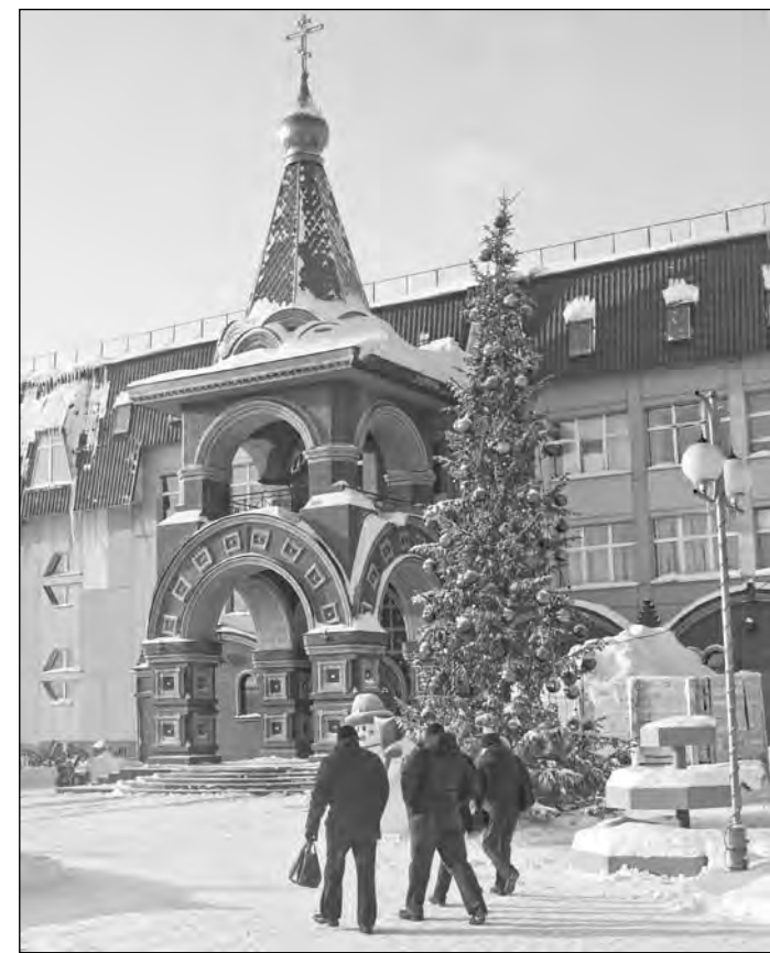
У АБК шахты «Заречной».