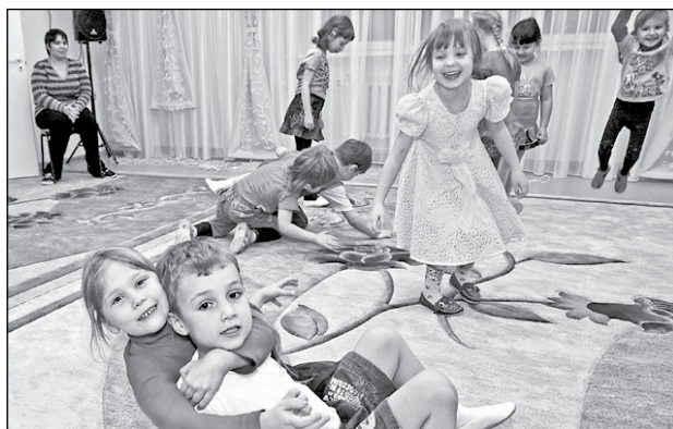
«Охват» дошкольным образованием в Кузбассе – самый высокий в СФО.

Впрочем, это только некоторые из задуманных образовательных проектов, о которых «Кузбасс» постарается рассказать в следующем году по мере их реализации.