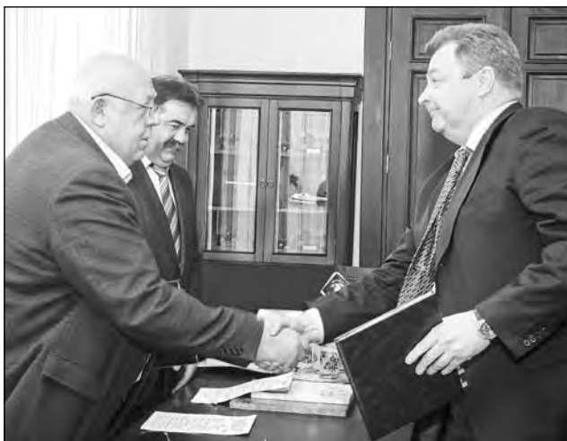
Замгубернатора Кемеровской области В.П. Мазикин и генеральный директор ОАО «Белон» В.В. Бахметьев на подписании Соглашения о социально-экономическом сотрудничестве.

- Мы стараемся не оставаться в стороне от задач, которые решает администрация Кемеровской области. В рамках нашего сотрудничества профинансировали празднование прошедшего Дня шахтера, перечислили средства в Кемеровский областной общественный фонд шах-