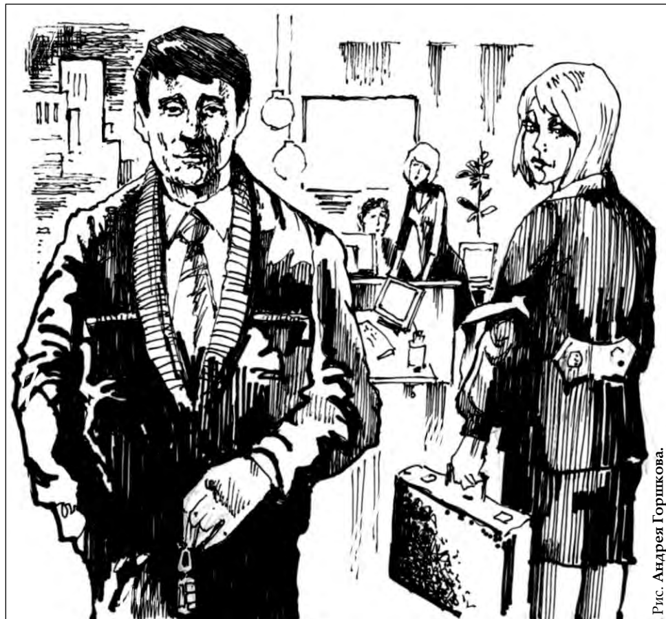
Рис. Андрея Горшкова.