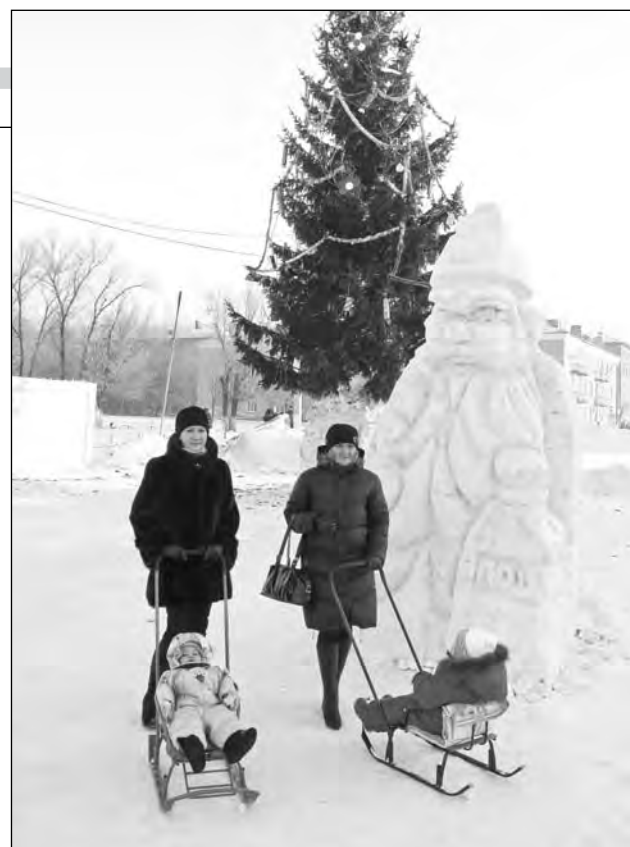
Снежный городок, построенный на средства компании «Белон» в Новом Городке (Белово), стал самым любимым местом отдыха для беловчан.

Надо сказать, что мы помогаем не только в рамках обязательств соглашения. По мере возможности стараемся не отказывать в поддержке обратившимся к нам как частным лицам, так и некоммерческим организациям. Например, была оказана помощь талантливому ребенку – выделены средства для поездки юной певице на международный конкурс в Маке-