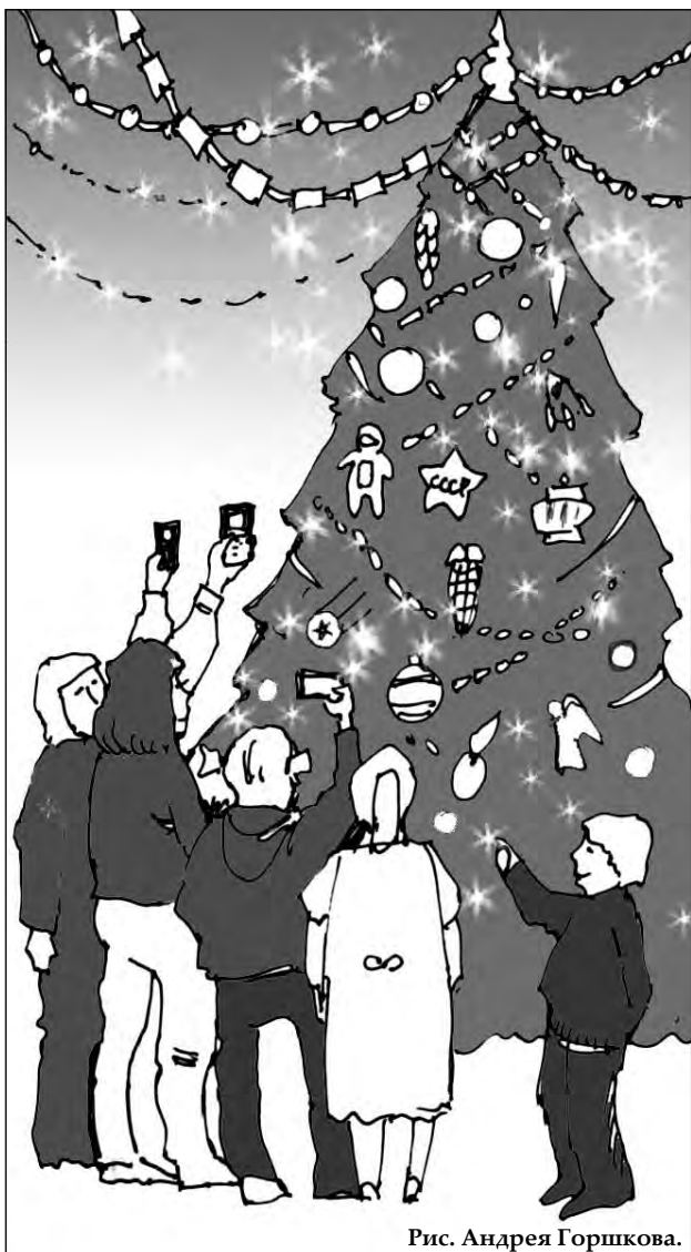
Рис. Андрея Горшкова.