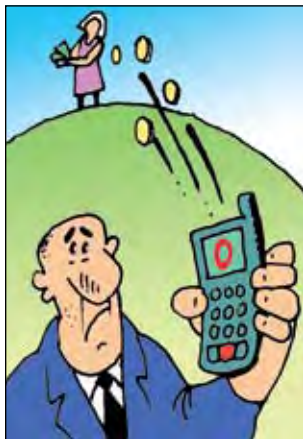
Рис. Андрея Горшкова.

Да, такая возможность в настоящее время имеется, но делать это должен судебный пристав-исполнитель. Согласно части 4 статьи 69 ФЗ «Об исполнительном производстве», при отсутствии или недостаточности у должника денежных средств взыскание обращается на иное имущество, принадлежащее ему на праве собственности, хозяйственного ведения и (или) оперативного управле-