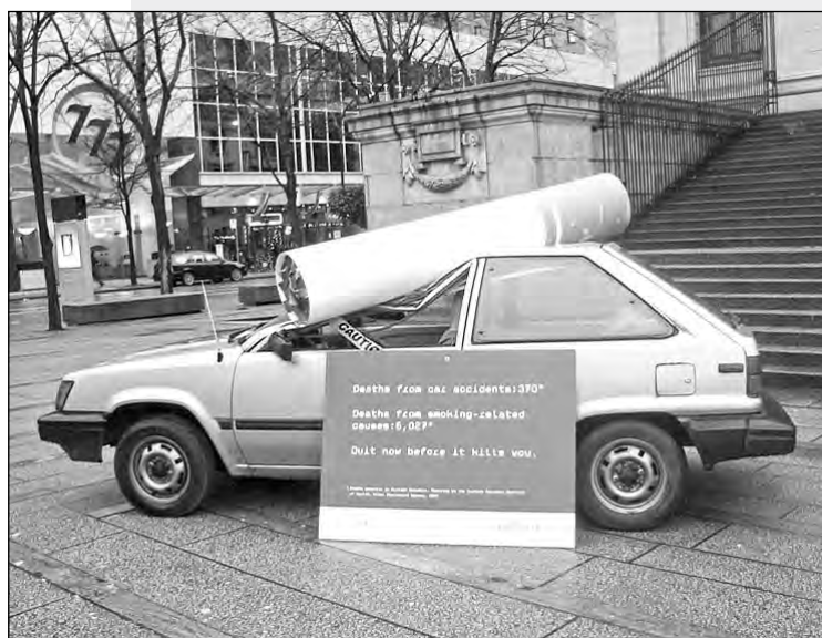
Число погибших в дорожных авариях - 370, число смертей, связанных с курением - 6027. Брось, пока это тебя не убило!

думаю, это на самом деле проблема заказчика, проблема власти. В итоге, на мой взгляд, просто полмиллиона государственных денег было выброшено на ветер.