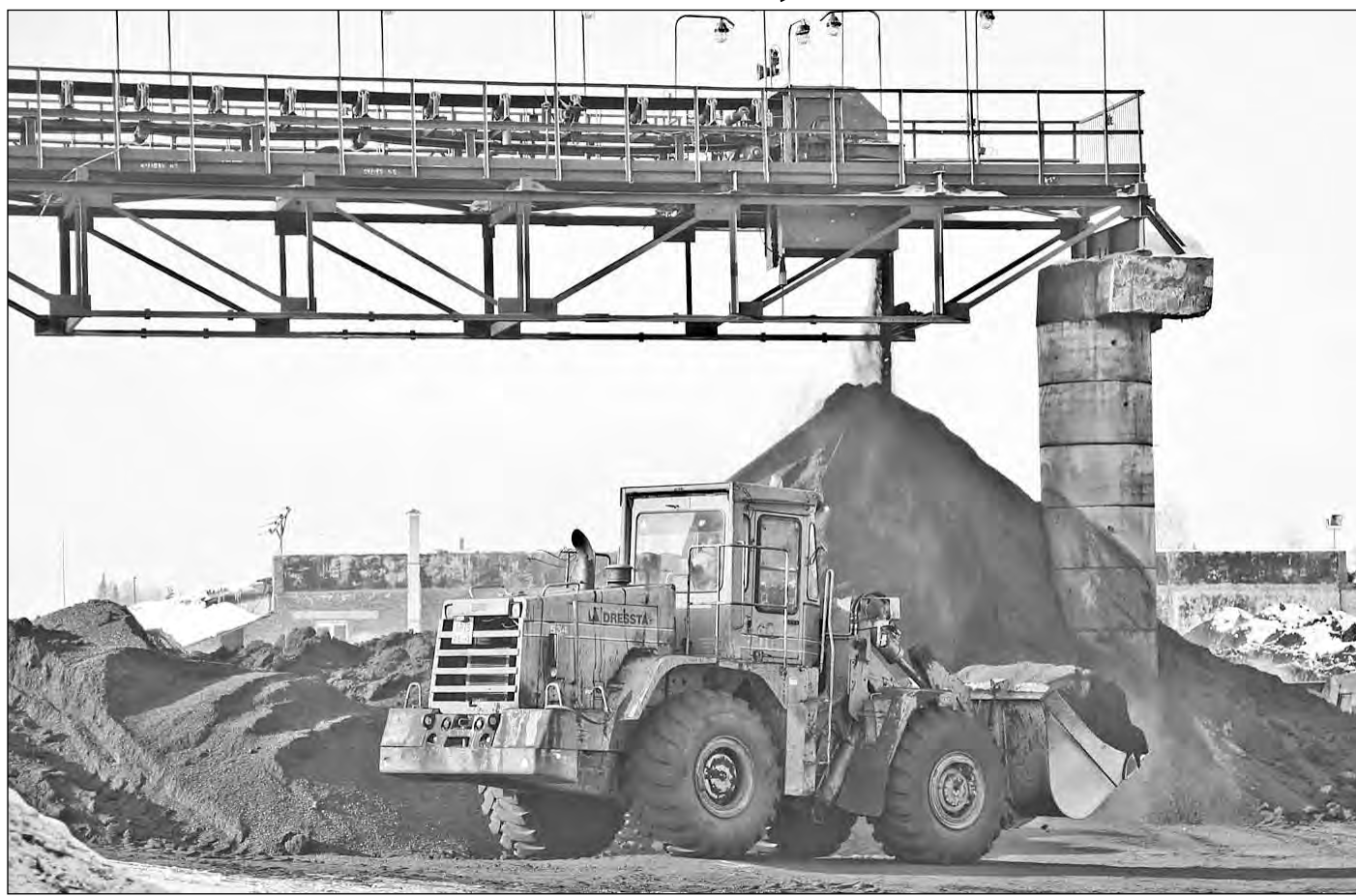
Запасов угля на складах для потребителей хватит. Сегодня главное – безопасность шахтеров.

На угледобывающих предприятиях Кузбасса в оставшиеся предпраздничные дни вводится особый режим работы, который предусматривает повышенные меры безопасности. Так угольщики отреагировали на просьбу губернатора области усилить бдительность, а по возможности приостановить основные производственные работы в связи с повышенной сейсмической напряженностью в районе стыка Тывы и Монголии.