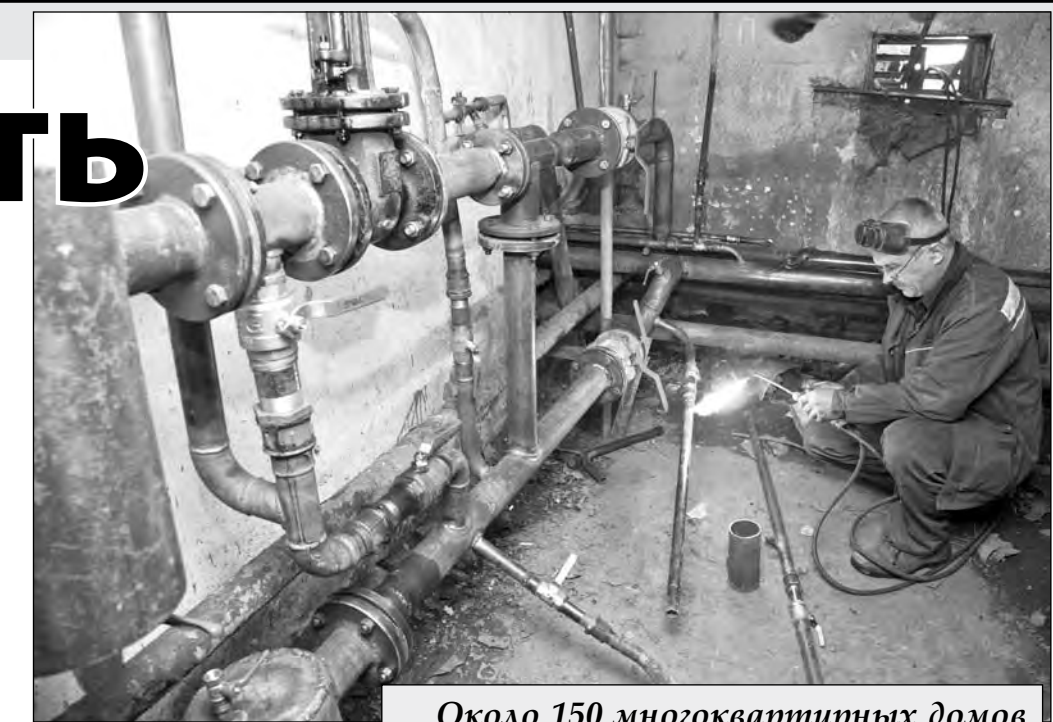
Около 150 многоквартирных домов старой застройки уже имеют пункты учета тепла.

Как же будет производиться «оприборивание» и сколько денег на это потребуются? Директор «Жилкомцентра» сообщает, что сначала нужно заказать проект. Особенно актуален он для домов старой застройки, где теплоточ не был предусмотрен технологически. Владальцам таких жилых помещений придется озаботиться данной проблемой в ближайшее время. Теперь о стоимости. Проект одного пункта теплосчета обойдется собственникам жилья примерно в 15 тыс. рублей. Узел учета устанавливается на вводе теплоносителя в