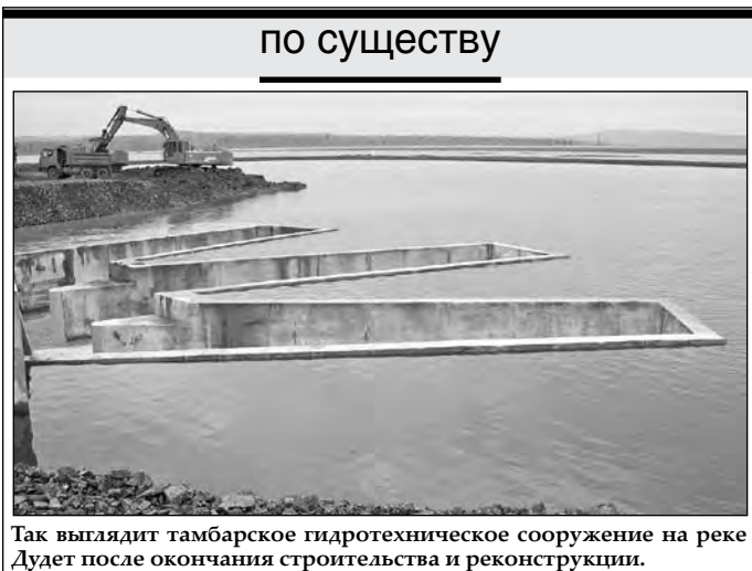
Так выглядит тамбарское гидротехническое сооружение на реке Дудет после окончания строительства и реконструкции.