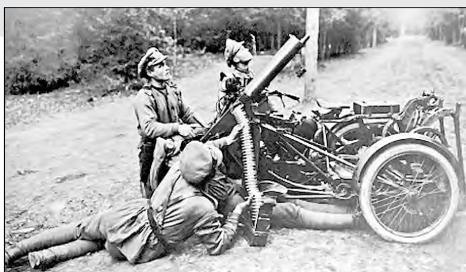
1916 год. Военнослужащие действующей армии стреляют из пулемета по аэронау.

Ноябрь 1919. Омск. По Северному морскому пути прибыли последние суда из Архангельска. Наладить стабильное сообщение через Северный Ледовитый океан поручалось специальной экспедиции во главе с капитаном Б. Вилькициком. Флотилия из 7 пароходов и 19 барж подтолкнули колчаковские министерства путей сообщения, продовольствия, земледелия, торговли и промышленности. А также представители сибирской кооперации, норвежских и английских торговых компаний. В начале августа 1919 суда отчалили из Омска и Новониколаевска вниз по Оби. В Архангельск отправлено 540 тысяч пудов зерна, 70 тысяч пудов масла, 30 тысяч пудов жиров, 28 тысяч пудов мёда, 4500 пудов (?) валенок. В обмен только в Омск прибыло около 100 тысяч пудов английского вооружения и обмундирования,