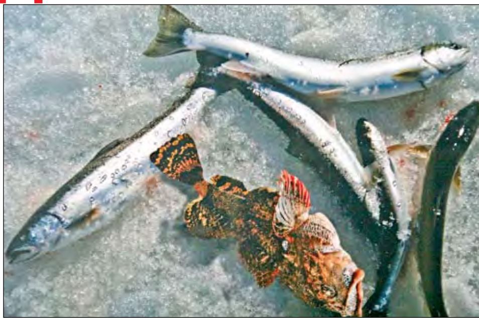
Мальма и бычок.

В основном новокузнецкий запечатлел северо-западное побережье Охотского моря, дикое места.