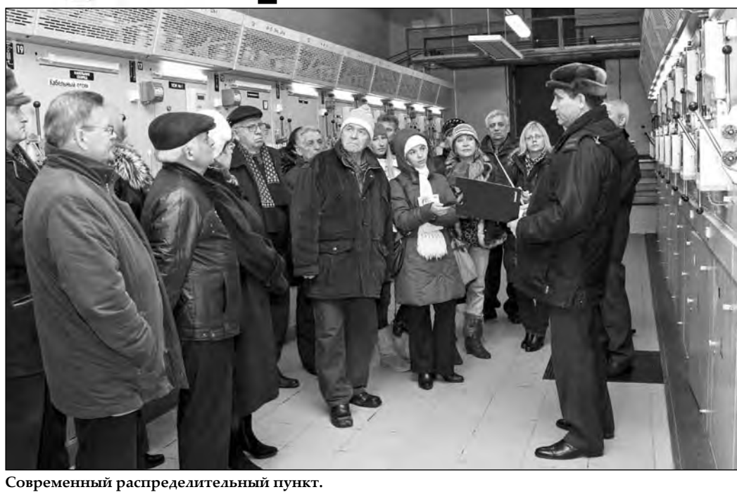
Современный распределительный пункт.