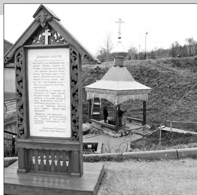
Скоро сюда «переселится» Преподобный Серафим Саровский.

...В келье святого всегда горели свечи, и он говорил: «Пока я жив, пожара не будет, а когда умру, кончина моя откроется пожаром».