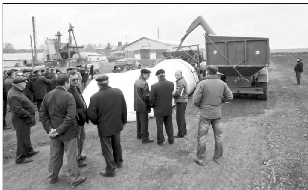
Новые технологии в действии.