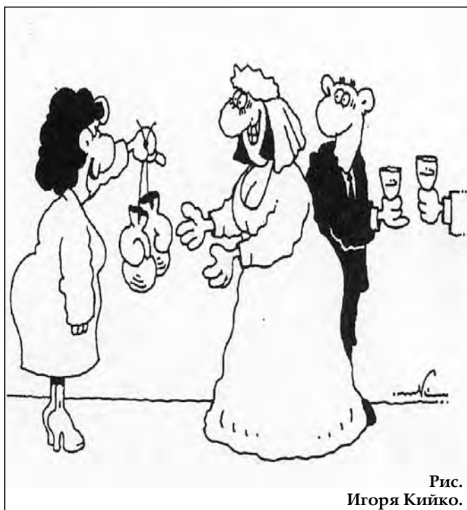
Рис. Игоря Кийко.

прилагается тесть? Ну вот зачем?! Игорь, 39 лет, промоутер: - Для меня неразрешимые вопросы в жизни - это выяснение грамотных отношений с агентством недвижимости и предупреждение всякого рода мошенничества. Уж как эти агентства строят отношения с клиентами - вообще для меня темный лес. Логике не поддается.