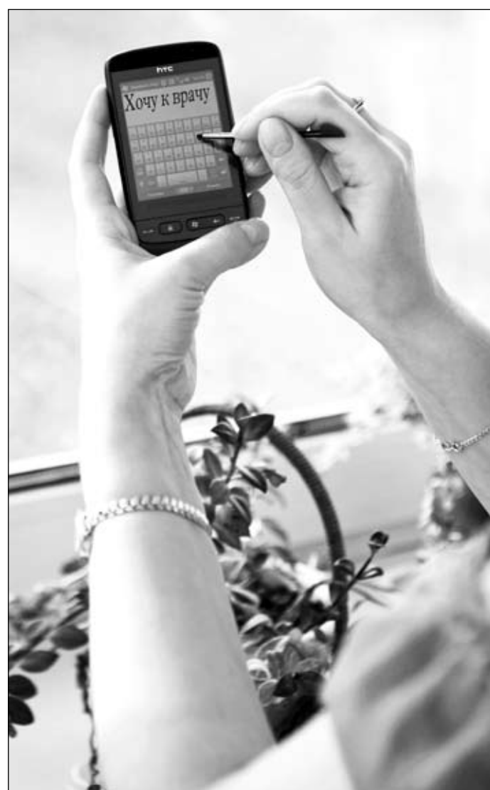
Уже в скором времени кузбассовцы смогут записаться на прием к врачу с любого компьютера и даже... с мобильного телефона.

Три кита Модернизация пойдет по пути улучшения материально-технической базы здравоохранения, внедрения в лечебный процесс современных информационных технологий, а также внедрения федеральных стандартов оказания медицинской помощи. База. Сегодня 17% больничных зданий Кузбасса находится в аварийном состоянии (по России ситуация еще хуже: 30%). В течение ближайших двух лет планируется завершить строительство