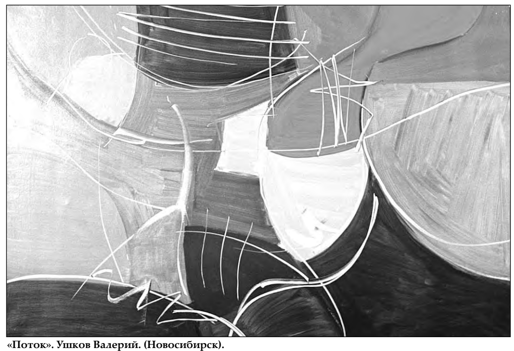
«Поток». Ушков Валерий. (Новосибирск).