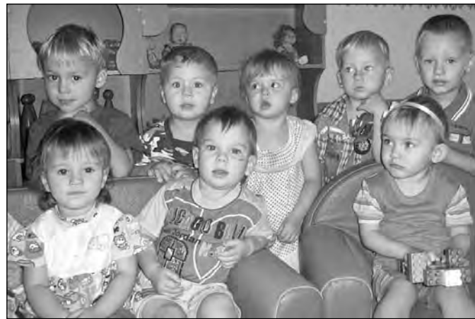
Юные хозяева детского сада «Солнышко».