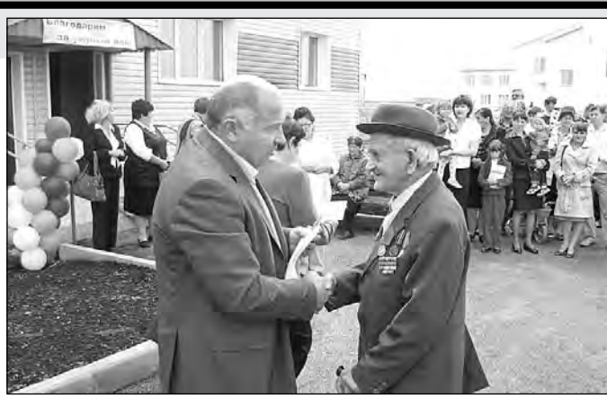
Новый 36-квартирный дом в Тяжине.

дополнительных дошкольных групп в райцентре и других населенных пунктах. Но этого уже недостаточно, на сегодня очередь в детские сады составляет 290 человек. Поэтому в ближайшем будущем планируем построить в Тяжине современный детский сад на 110 мест, уже определен проект, следана привязка. Кроме того, провели реконструкцию детского садика в Даниловке, увеличили на 20 мест школу-сад в с. Октябрьском, где теперь будет три дошкольных группы разных возрастов. Решен вопрос с финансированием ремонта еще двух садиков в райцентре – №5 и бывшего заводского. Во многих селах мы сохранили старые детские сады, сегодня по мере возможности оснащаем их новым оборудованием и удобной красивой