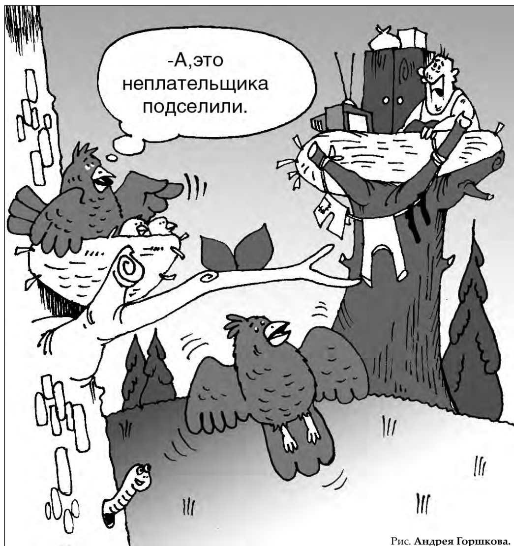
Рис. Андрея Горшково.

С другой стороны, в погашении долгов явно наметилась положительная динамика. На 1 января 2010 г. дебиторская задолженность граждан составляла 2052 млн.