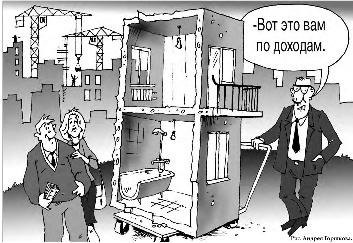
Рис. Андрея Горшково.