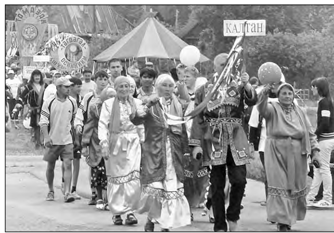
Шорцы компактно проживают на юге Кузбасса, а количество представителей этого народа составляет 12585 человек. Места компактного проживания телеутов в Кемеровской области – село Беково Беловского района, деревня Шанда Гурьевского района, микрорайон Телеут и село Заречное города Белово. Общая их численность в Кузбассе – чуть более 2500 человек.