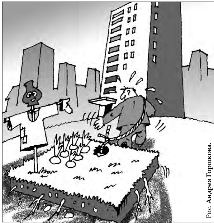
Рис. Андрей Горюнов.

– Но мой огород был в стороне от дома. И вообще я