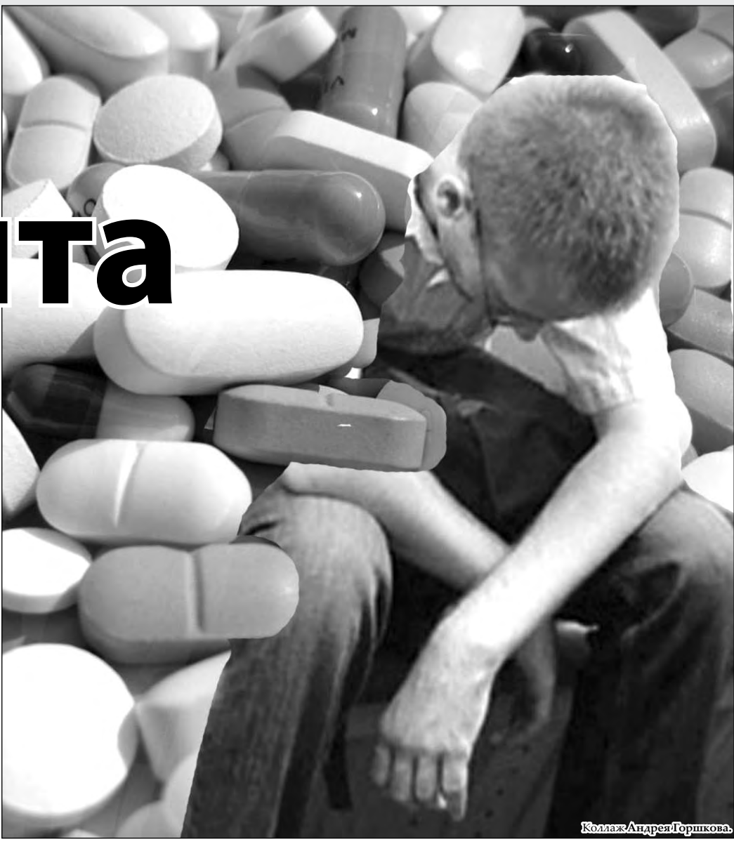
Коллаж: Андрей Горшков

Что касается Кемеровской области, то объемы реализации в аптечной сети кодеиносодержащих лекарственных препаратов за последние два года у нас выросли чуть ли не вдвое: в 2008 году их было продано свыше 660 тыс. упаковок таблеток, капсул и растворов, в 2009-м – уже 1,02 млн. Конечно, с одной стороны, это, безусловно, можно объяснить мощной рекламой таких лекарств. Но даже учитывая это, как полагают специалисты, у нас просто нет