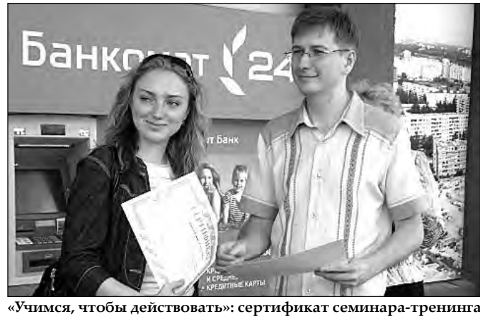
«Учимся, чтобы действовать»: сертификат семинара-тренинга – подтверждение полученных знаний.

Как подарить людям радость, украсить летнюю аллею цветущими клумбами? Как зимой построить такие горки, чтобы они были похожи на горки чьей-то мечты? Как организовать спортивные соревнования, чтобы в них участвовало как можно больше жителей микрорайона? На эти вопросы теперь знают ответы школьники г. Киселевска, участники семинара-тренинга «Социальное проектирование как механизм развития социального партнерства при решении социально значимых проблем территории», организованного в Омске с 10 по 14 июня некоммерческой организацией «Фонд социально-экономической поддержки регионов» «СУЭК – РЕГИОНАМ» и фондом «Новая Евразия» в рамках программы «Поддержка молодежных инициатив». ОАО «СУЭК» считает необходимым вносить свой конкретный вклад в социальное и экономическое развитие регионов присутствия.