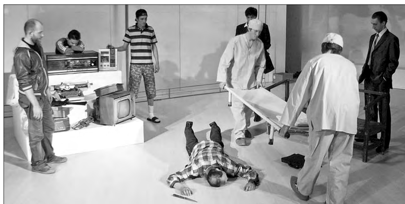
Сцена из спектакля «Экспонатъ».

В нынешнем году на фестиваль пригласили спектакль «Экспонатъ» по пьесе современного драматурга Вячеслава Дуренкова. Премьера состоялась в марте. Режиссёр-постановщик Марат Гандалов (Москва), художник-постановщик Фемистокл Атамасас (Санкт-Петербург). Пожалуй, это самая громкая и, не побоюсь этого слова, скандальная премьера Прокопьевского драматического в нынешнем сезоне. В мае спектакль увидели участники театрального фестиваля «Новосибирский транзит». В Лысьве состоя-