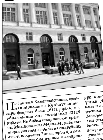
По данным Кемеровского государственного университета культуры и искусств, в филиале в Междуреченске обучается около 200 человек. В год в филиал было вложено свыше 14 миллионов рублей.

Речь ведь не о том, чтобы оглушить и закрыть филиал. Речь о том, что, если в городе с населением в сто тысяч, филиал может